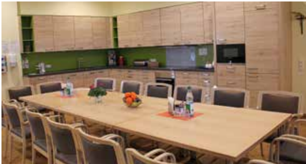
Blick in die Wohnküche der Tagesklinik

Die Tagesklinik in Aachen ermöglicht eine wohnortnahe Versorgung.